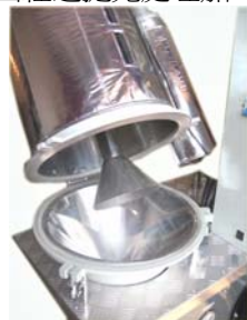
機身採用光學級不銹鋼及表面經過拋光處理加工