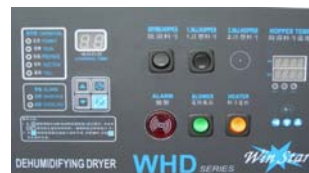
精簡易用控制器 (只需設置送料時間及按鈕開關便可)